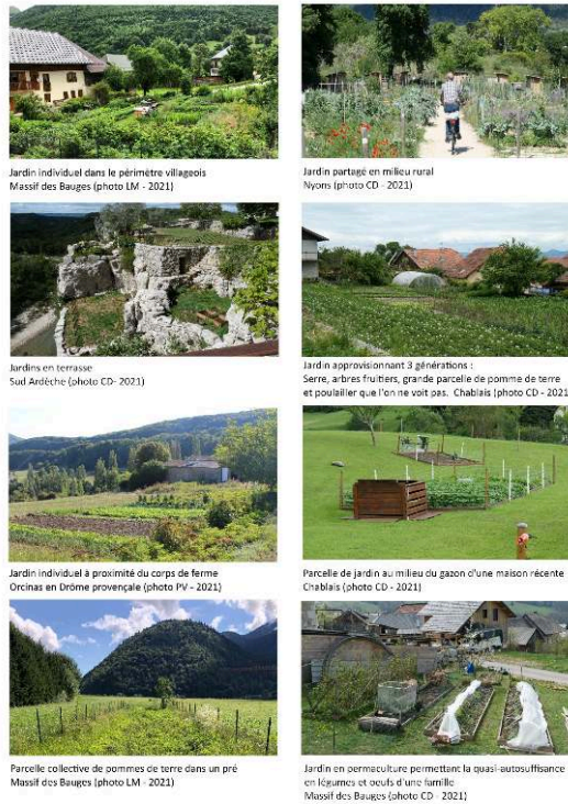
Figure 2 : Planche de photographies de différents types de jardins de moyenne montagne en région Auvergne-Rhône-Alpes.